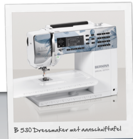
B 530 Dressmaker met aanschuiftafel