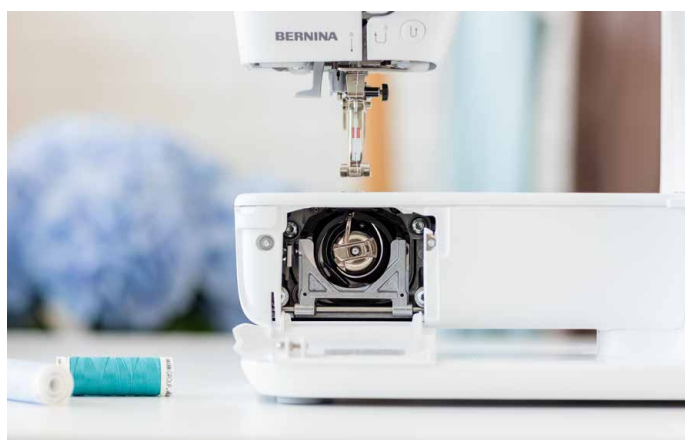
Sostituzione frontale della spolina, grazie al crochet verticale