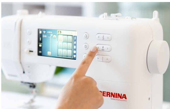
Operação simples através do ecrã tátil e dos botões de seleção direta