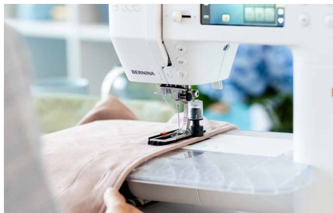
Casas de botão perfeitas com o calcador de casear automático #3A