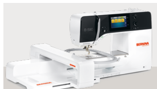
B590: 4.799 € 🚫 ⚙️ 🧺 inkl. Stickmodul