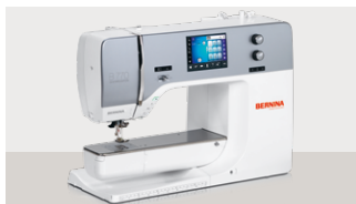
B770 QE: 4.399 € 🚫 🧺 ⚙️ mit Stickmodul: 5.399 €