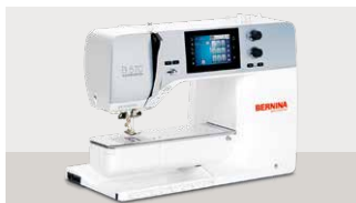
B570 QE: 3.299 € 🚫 🧺 ⚙️ mit Stickmodul: 4.199 €