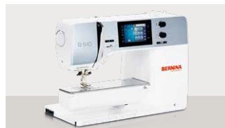
B540: 2.599 € 🚫 ⚙️ mit Stickmodul: 3.499 €

⚙️ Sticken ⚙️ Sticken optional 🧺 Quilten 🚫 Nähen