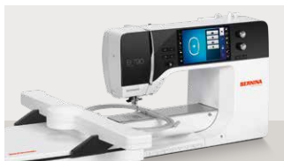
B790 PLUS: 7.899 € 🚫 ⚙️ 🧺 inkl. Stickmodul