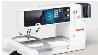
B880 PLUS: 9.299 € 🚫 ⚙️ 🧺 inkl. Stickmodul