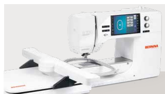
B700: 4.199 € ⚙️ inkl. Stickmodul