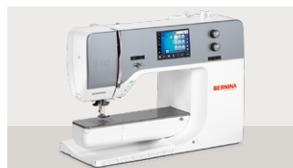
B740: 3.499 € 🚫