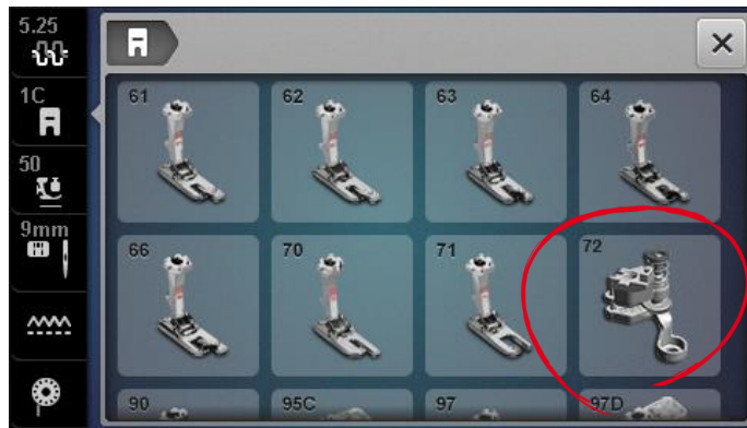
Beispiel des B 770QE / 740 / 720 Userinterfaces. Fuss Empfehlung