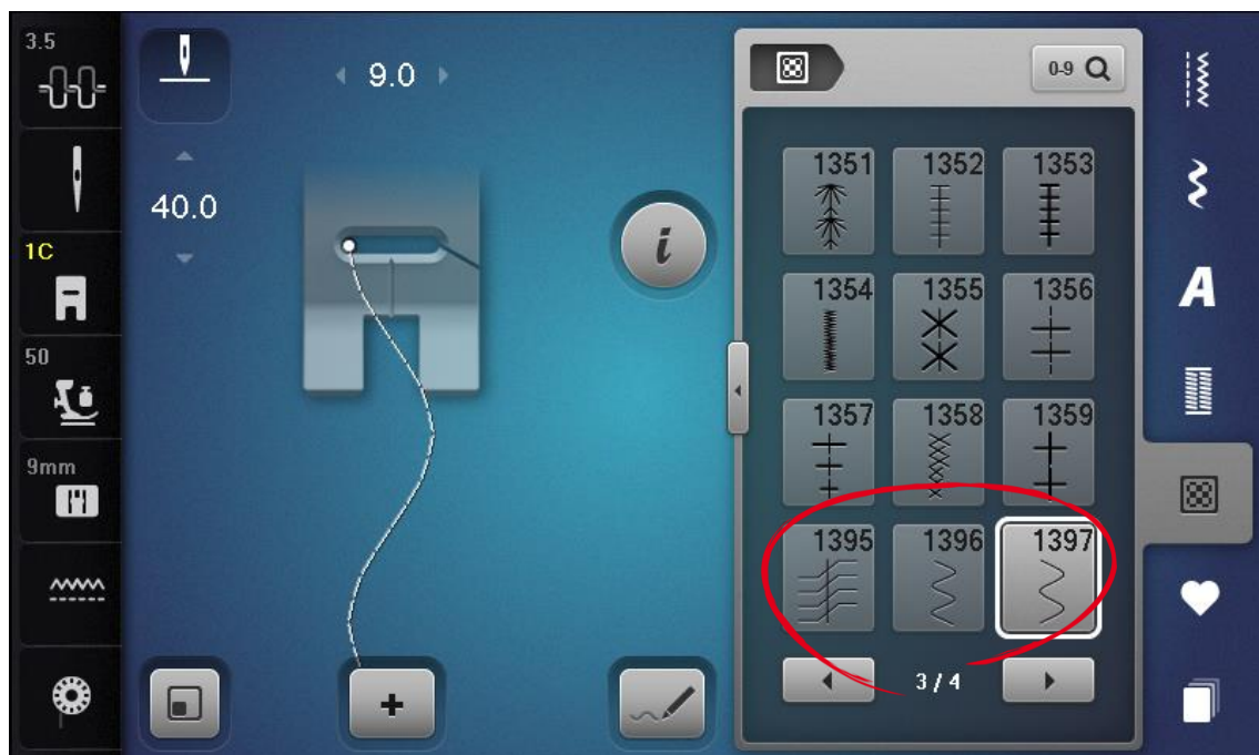
Beispiel des B 790 Userinterfaces