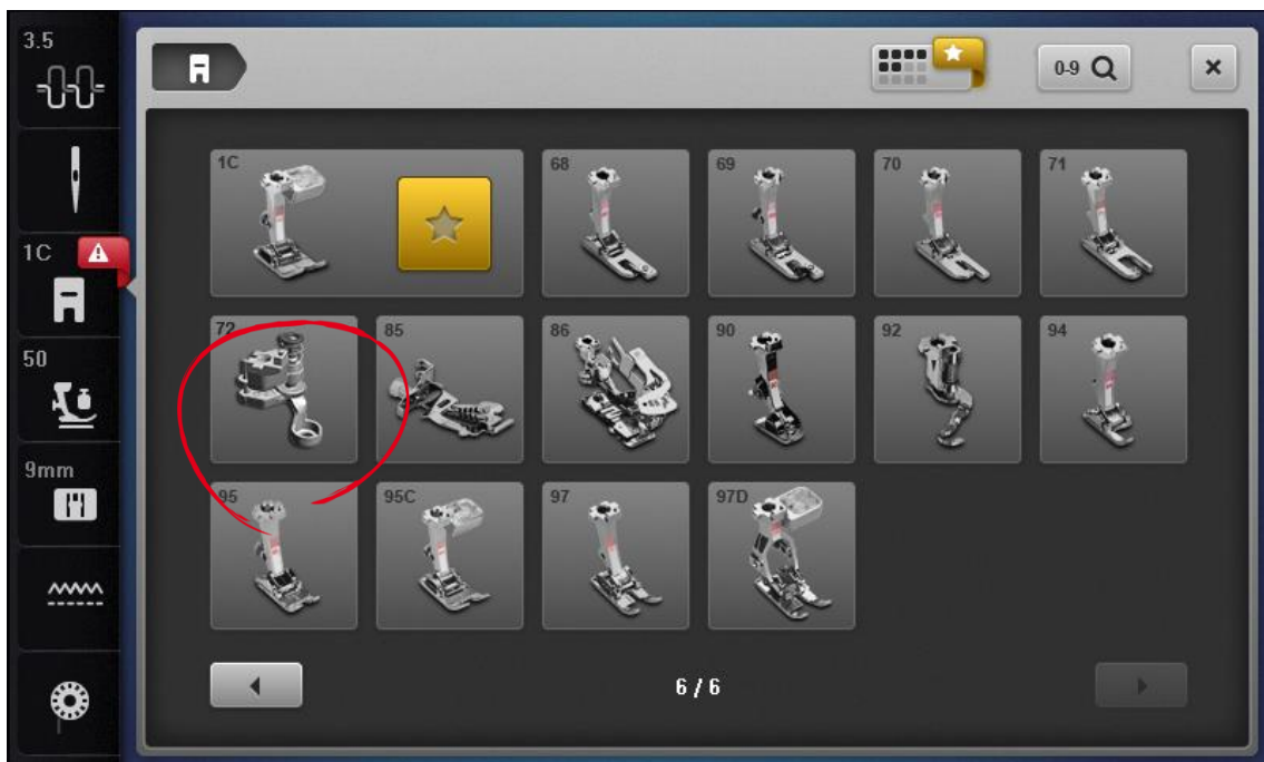
Beispiel des B 790 Userinterface. Fuss Auswahl

Der neue optional verfügbare Nähfuss „Verstellbarer Rulerfuss #72“ wird nun angezeigt, empfohlen (nur B 720 / 740 / 770QE) und kann ausgewählt werden (nur B 790). Mit Hilfe des höhenverstellbaren Nähfusses kann freihand gequiltet werden oder entlang einer Schablone. Mittels der Höhenverstellung kann die Fusssohlenhöhe entsprechend der Stoffdicke optimal eingestellt werden.