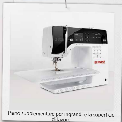
Piano supplementare per ingrandire la superficie di lavoro