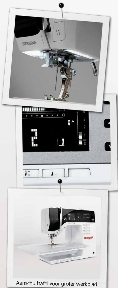
Aanschuiftafel voor groter werkblad

Lees meer over de BERNINA 3-serie en download gratis de werkbeschrijving van de party outfit: www.bernina.com/3series .