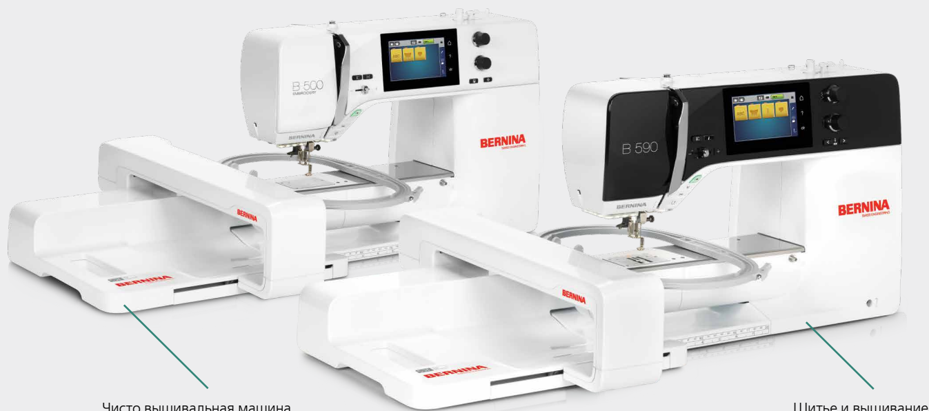
Чисто вышивальная машина